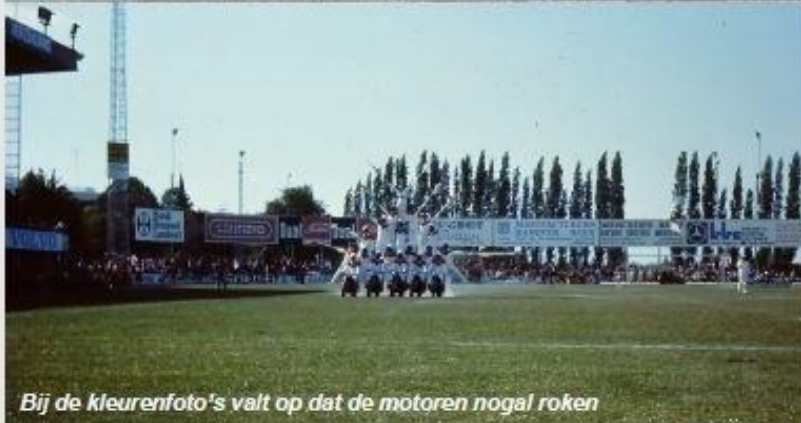
Bij de kleurenfoto's valt op dat de motoren nogal roken